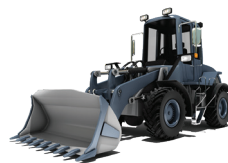
KOMPAKTOWE ŁADOWARKI KOŁOWE